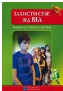
Захисти себе від ВІЛ. Тренінги життєвих навичок: Посібник для учнів старшого підліткового та юнацького віку – 182,000 прим.