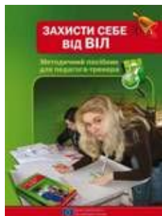
«Захисти себе від ВІЛ». Посібник для педагога-тренера – 10,000 прим.

Керівники системи освіти підтримали включення до шкільної програми програм превентивної освіти в подоланні епідемії ВІЛ/СНІДу. У мотиваційних нарадах щодо забезпечення впровадження проекту на національному рівні взяли участь 54 регіональні адміністратори, понад 1300 керівників системи освіти районних рівнів і 615 керівників базових шкіл. Як результат, в усіх регіонах було видано накази управлінськ освіти і науки щодо інституалізації результатів проекту Європейського Союзу в освітньому секторі.