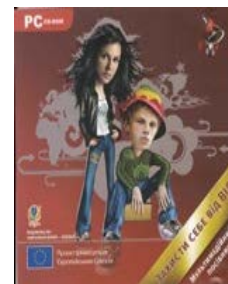
«Захисти себе від ВІЛ». Мультимедійний посібник – 10,000 прим.